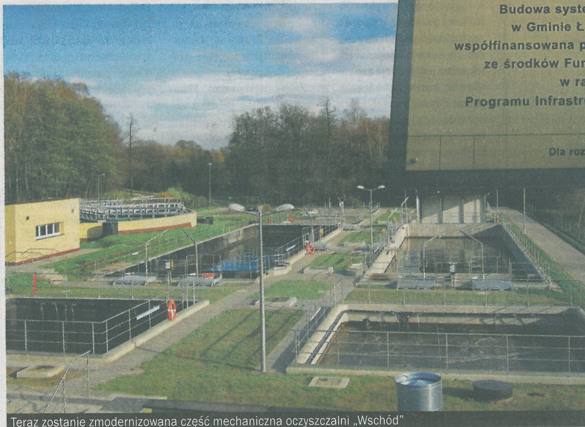
Teraz zostanie zmodernizowana część mechaniczna oczyszczalni „Wschód”

- Budowa kanalizacji w Łaziskach Górnych to projekt, który rozpoczynałem, jako prezes PGKIM oraz Pełnomocnik ds. realizacji projektu. W ocenie Wojewódzkiego Funduszu Ochrony Środowiska i GW w Katowicach jest jednym z najlepszych i najlepiej realizowanych w regionie oraz przykładem dobrego wykorzystania środków unijnych. Stąd też decyzja o jego rozszerzeniu i przyznaniu kolejnych środków.