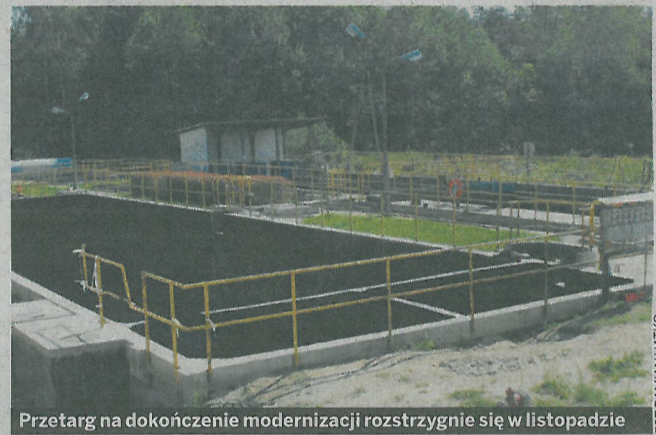
Przetarg na dokończenie modernizacji rozstrzygnie się w listopadzie

W poniedziałek odbyły się konsultacje społeczne dotyczące m.in. oczyszczalni „Wschód”. DH